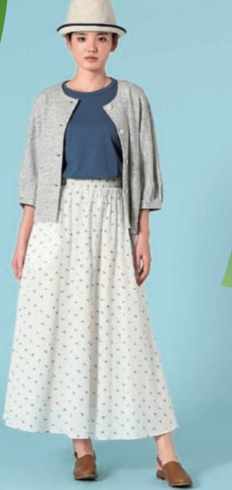
3種類のシルクが楽しめるコレクション。