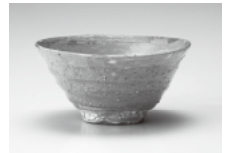
藏六窯(四代・京都) 青井戸 茶盃 銘「眞」 而妙斎お家元書付