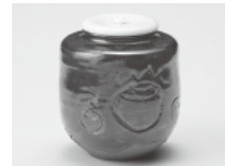
亀塚窯(福山・京都) 鉄釉 茶入 尋牛齋宗匠 自彫