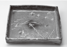
玄々窯(徹・唐津) 黒唐津網千鳥文足付 八寸